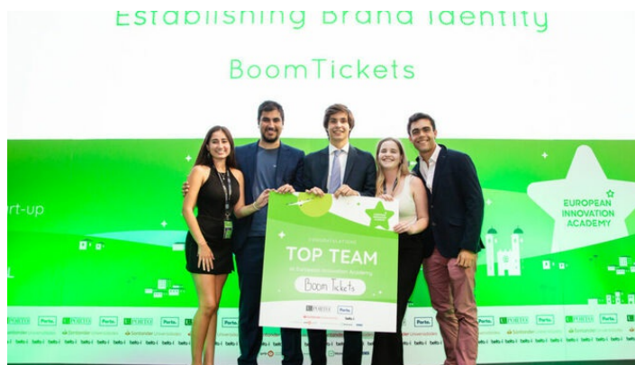
El equipo ganador de la 'startup' BoomTickets. / M. G.